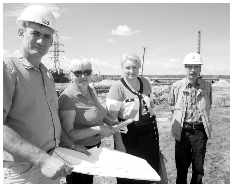
Инициативная группа проекта.

парковка, спортивная площадка, детская игровая площадка. При строительстве будут применены энергоэффективные технологии. Установка солнечных батарей позволит вырабатывать электричество для освещения подъездов и наружного освещения. При строительстве планируется применить новую технологию приготовления горячей воды с использованием высокоскоростных теплообменников. Это позволит значительно сократить расходы жителей на жилье. Обеспечить доступную стоимость жилья является одним из условий реализации проекта «Воротынская роща». В настоящее время опубликована проектная декларация, открыта продажа квартир. В первом строящемся доме 2-комнатные квартиры площадью 55 м 2 и 3-комнатные квартиры 64 м 2 . Все